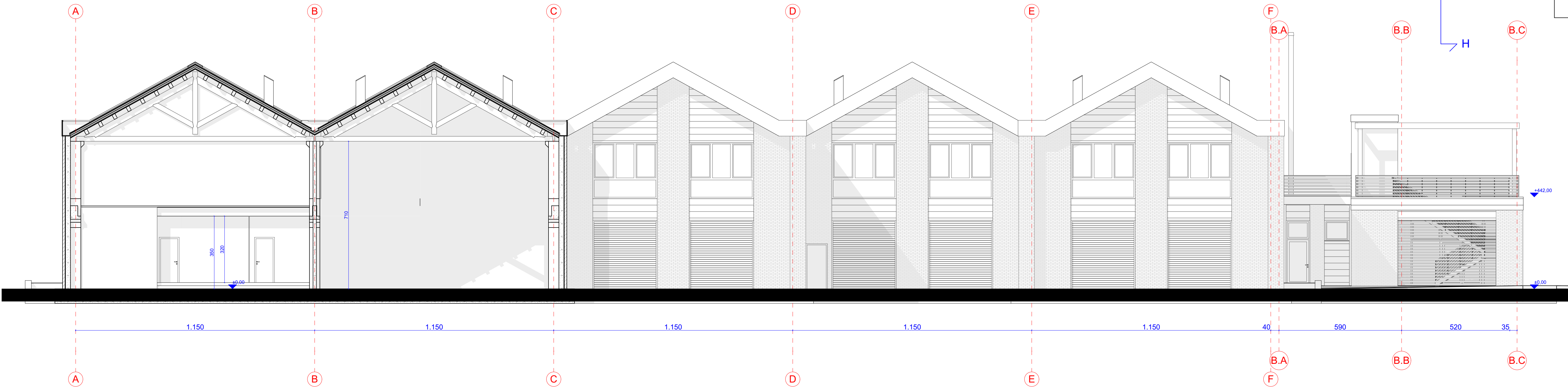
SEZIONE H-H' | SCALA 1:100