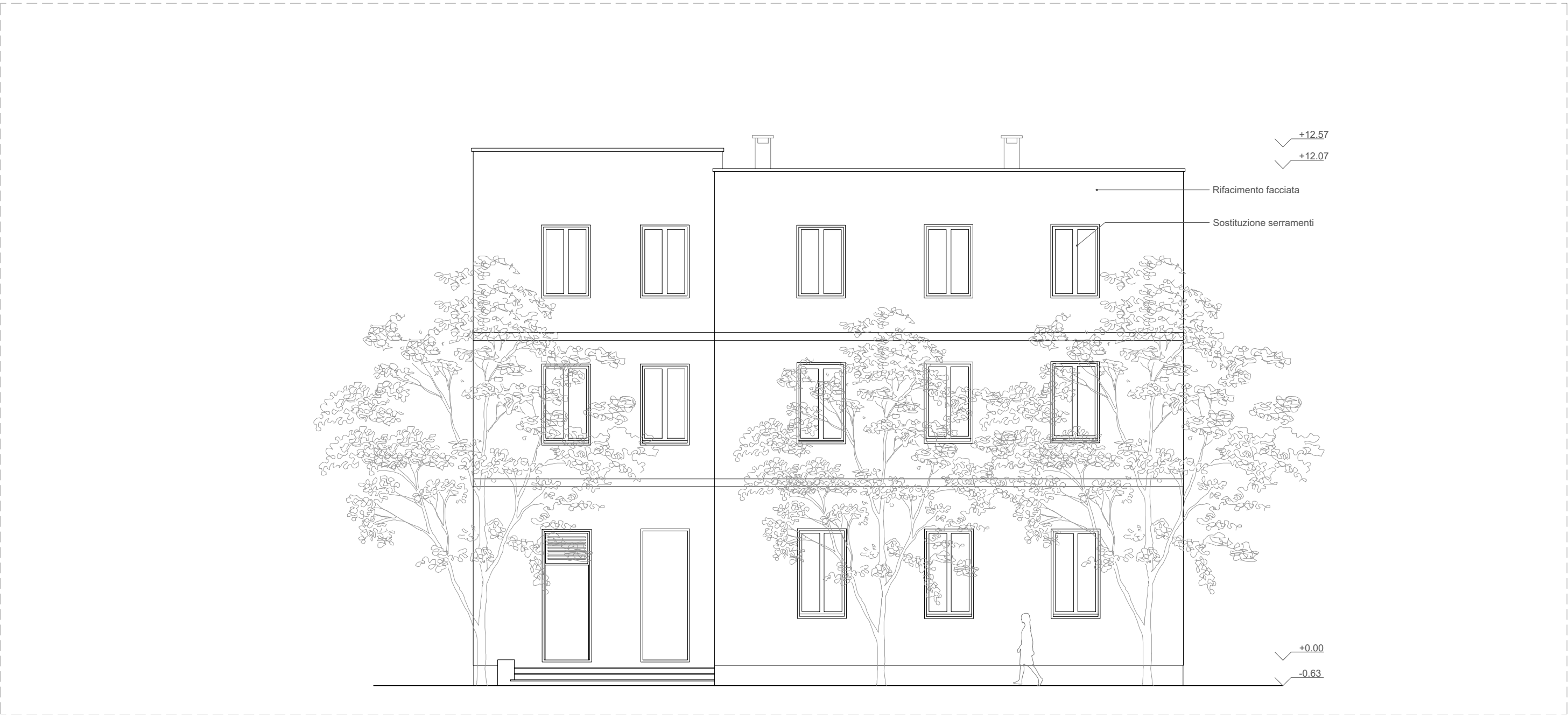
PROSPETTO OVEST - Scala 1:100