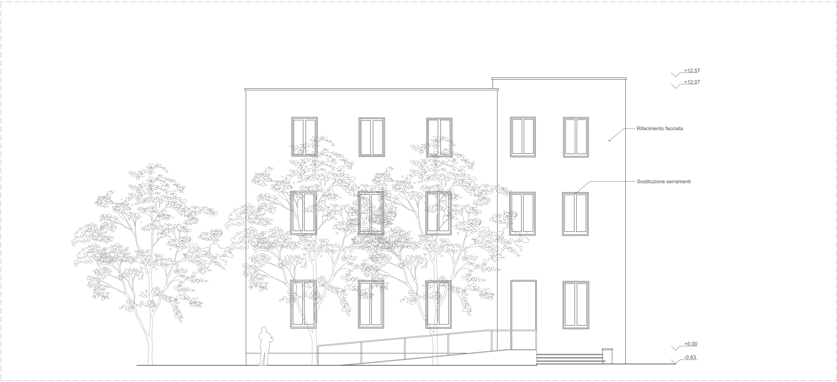
PROSPETTO EST - Scala 1:100