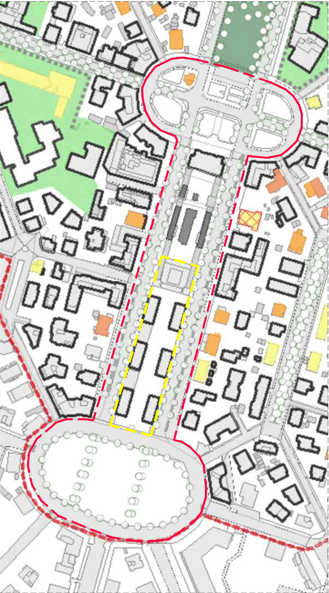
ESTRATTO PRG CON EVIDENZIATA L'AREA D'INTERVENTO - SCALA 1:2000