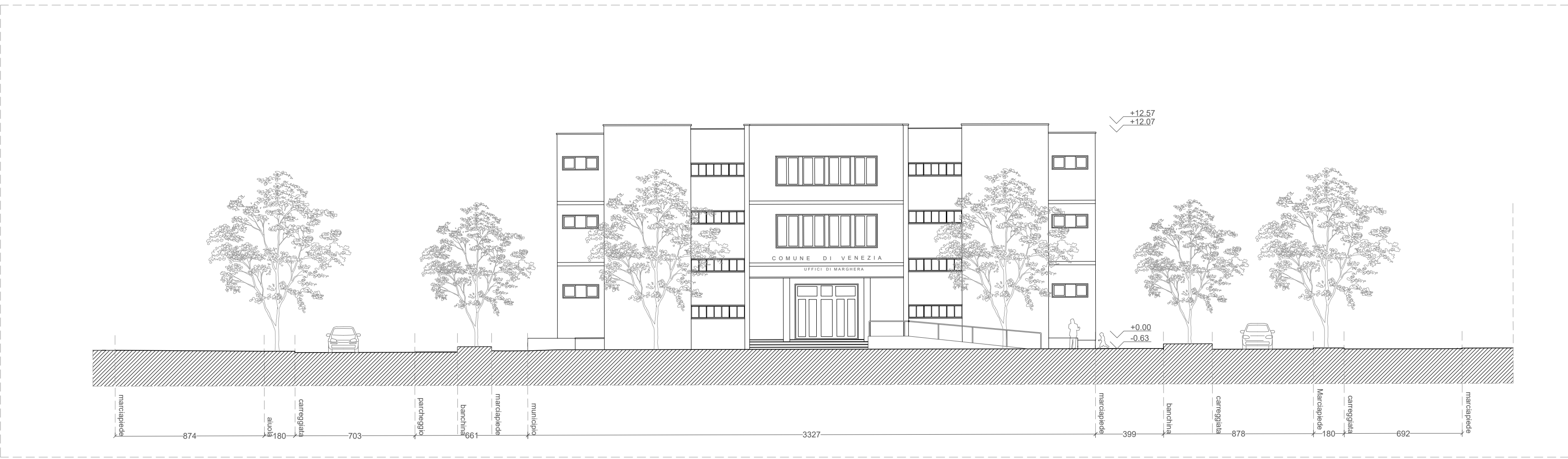
SEZIONE B-B - Scala 1:200