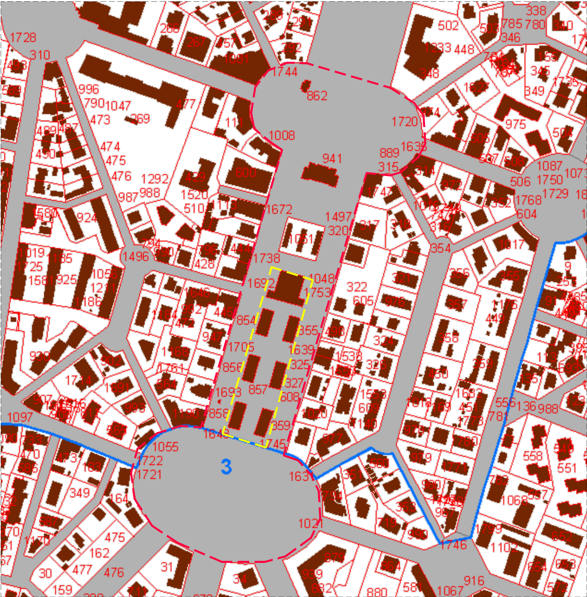
CARTOGRAFIA CATASTALE CON EVIDENZIATA L'AREA D'INTERVENTO - SCALA 1:2000