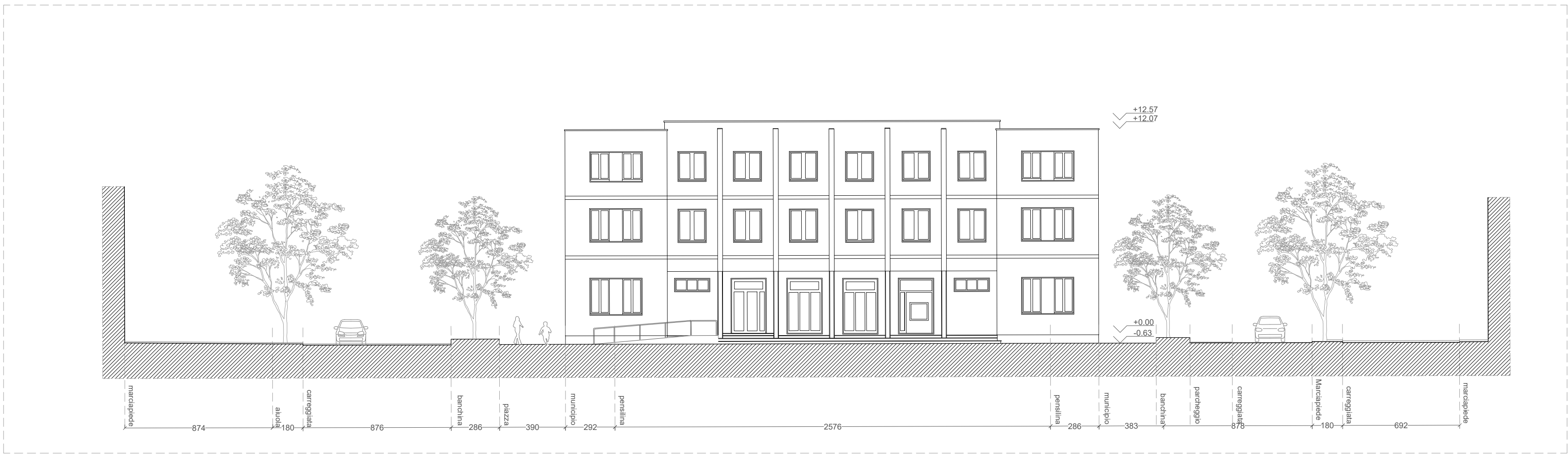
SEZIONE C-C - Scala 1:200