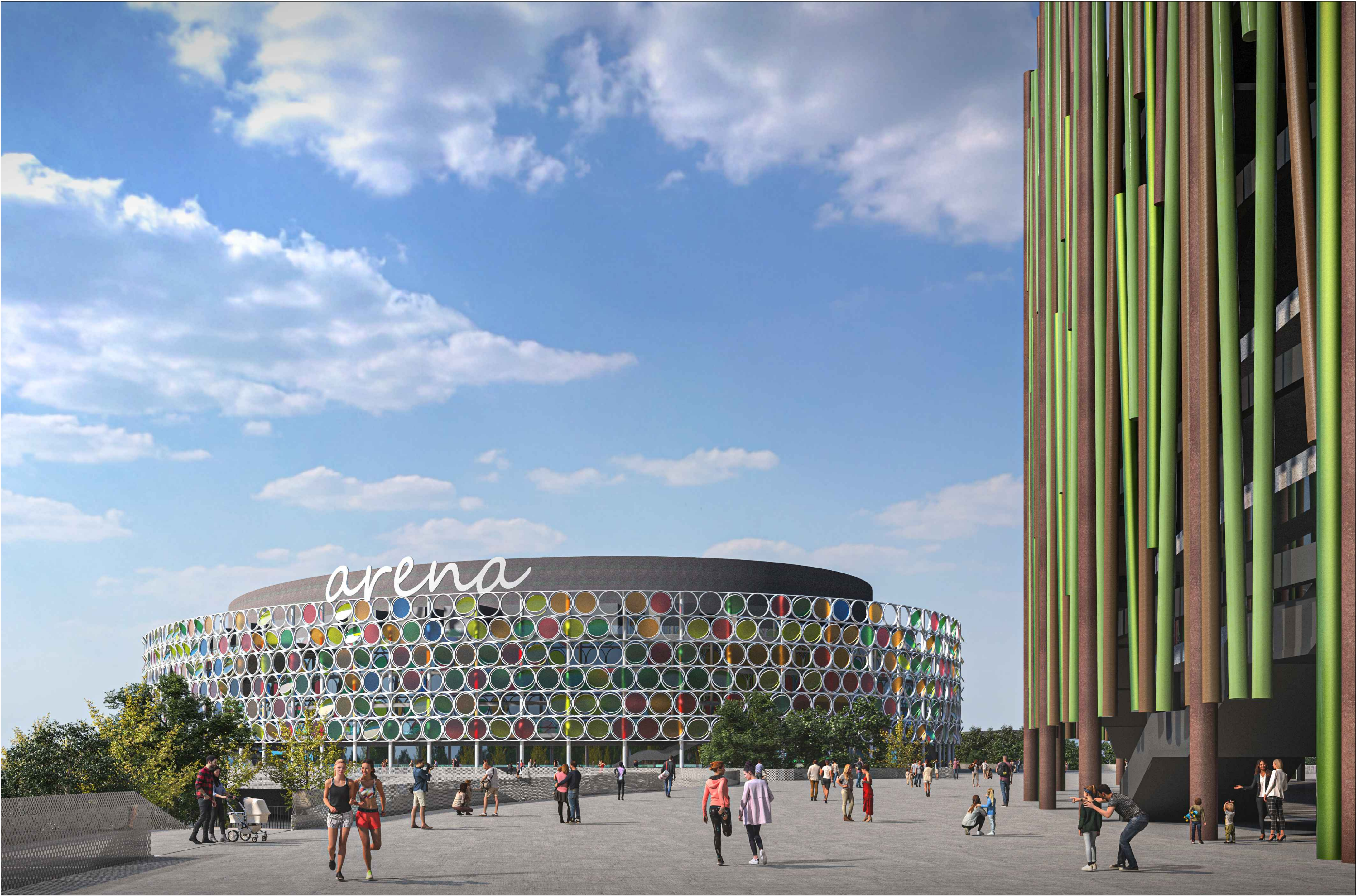
VISTA GENERALE N.1