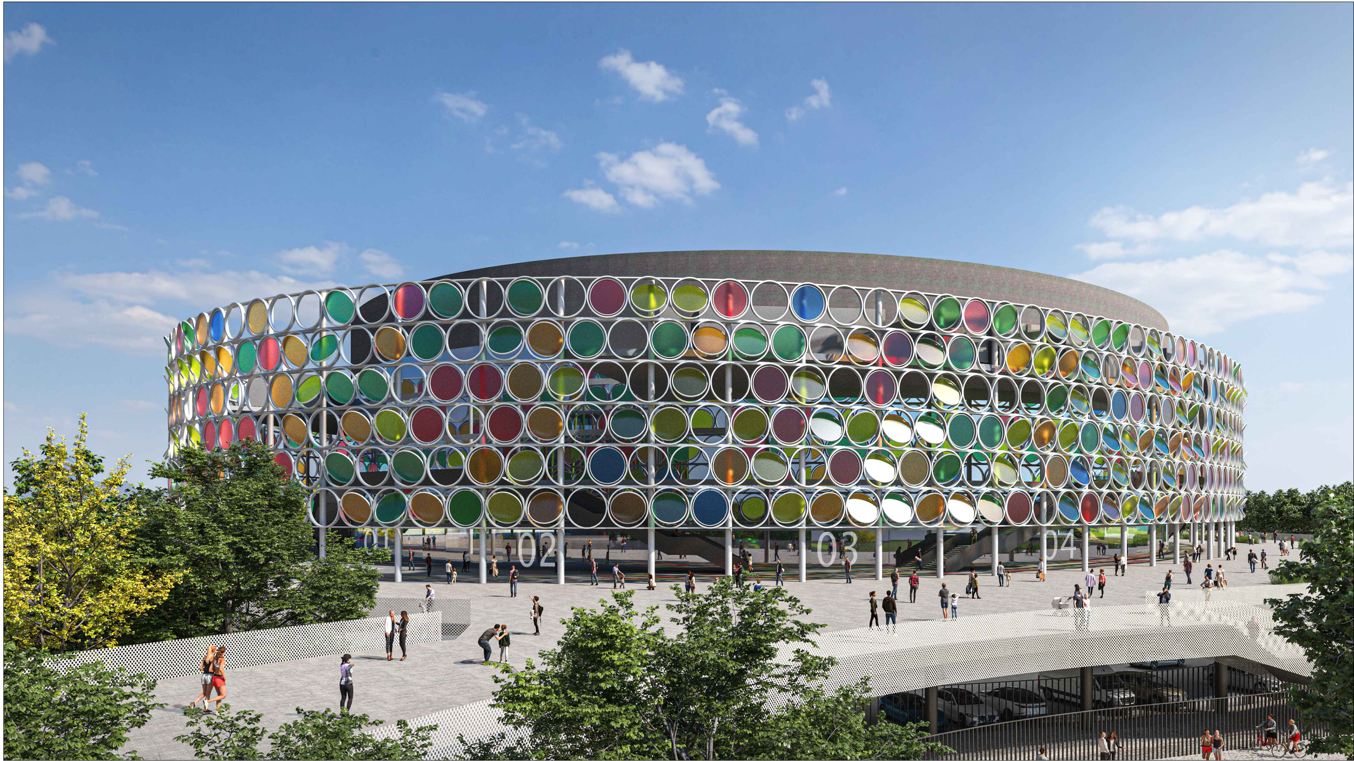
VISTA GENERALE N.2