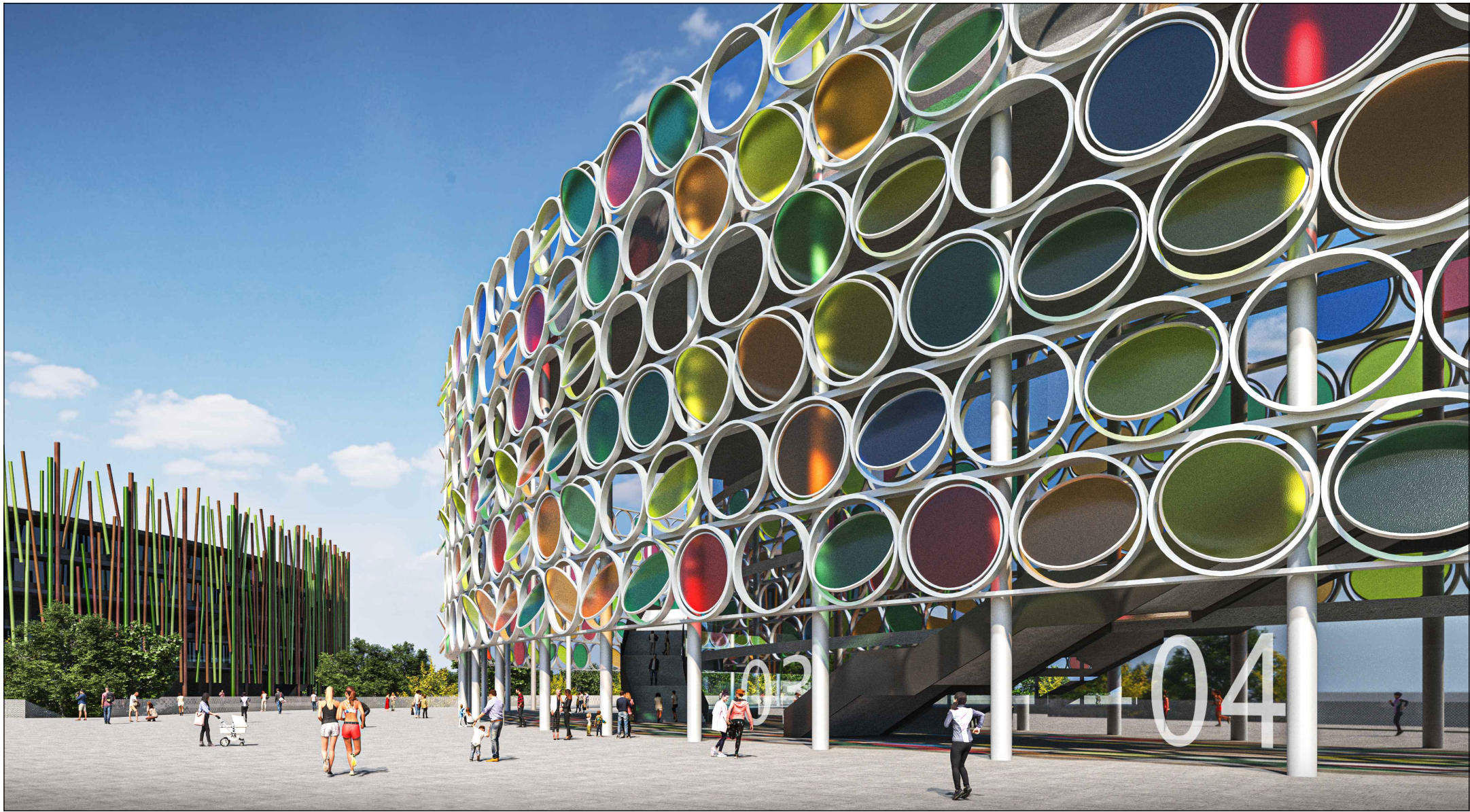
VISTA GENERALE N.3